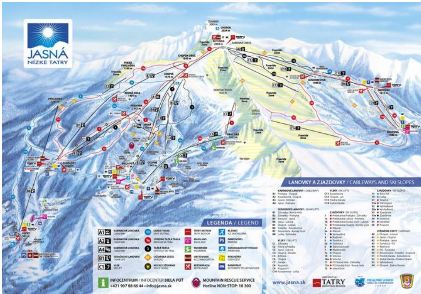
HOTEL KOSODREVINA – priamo na zjazdovke, vyjdete z hotela a lyžujete....