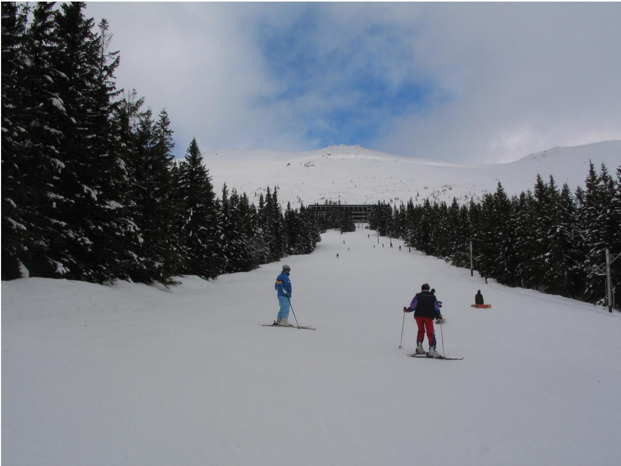
Pohľad na Predné Dereše (jeden zo svahov v hornej časti strediska)